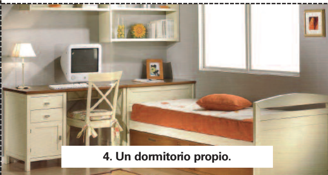
4. Un dormitorio propio.