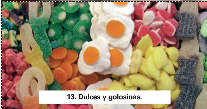
13. Dulces y golosinas.