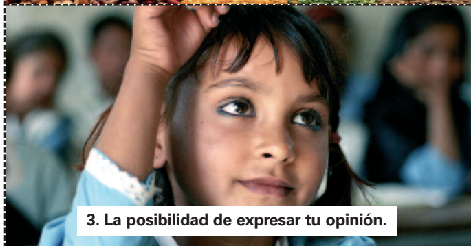
3. La posibilidad de expresar tu opinión.