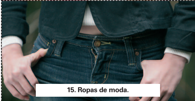
15. Ropas de moda.