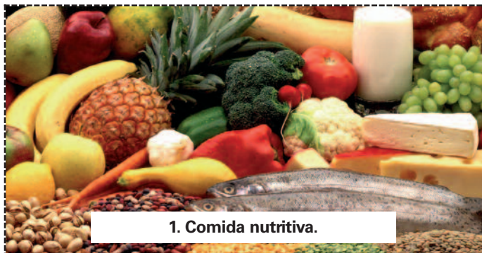
1. Comida nutritiva.