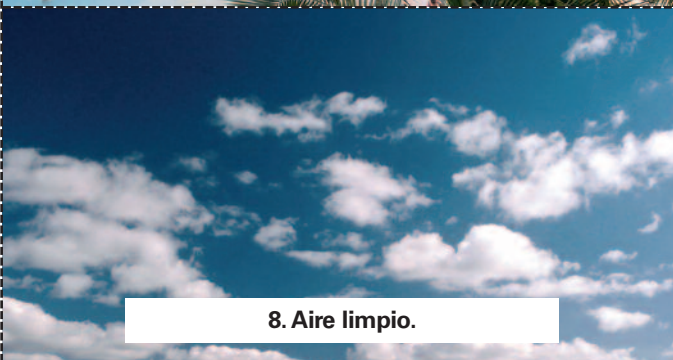
8. Aire limpio.