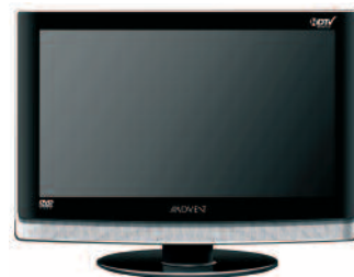
2. Un televisor.