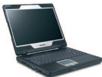
7. Un ordenador.