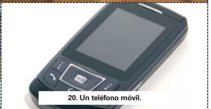
20. Un teléfono móvil.