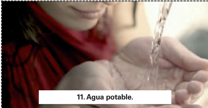
11. Agua potable.