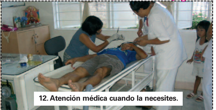
12. Atención médica cuando la necesites.