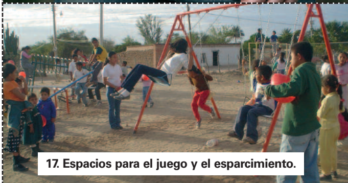
17. Espacios para el juego y el esparcimiento.