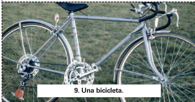
9. Una bicicleta.