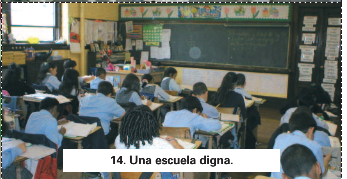
14. Una escuela digna.