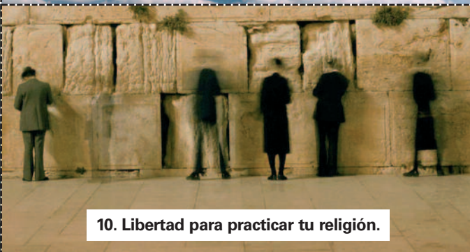
10. Libertad para practicar tu religión.