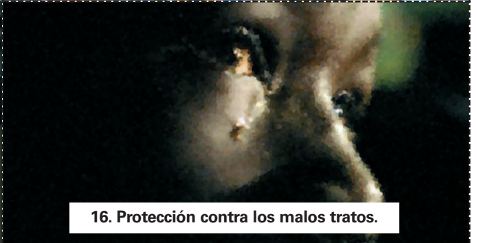
16. Protección contra los malos tratos.