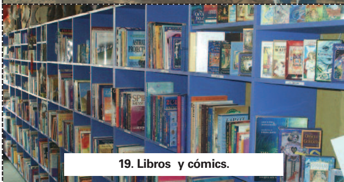
19. Libros y cómics.