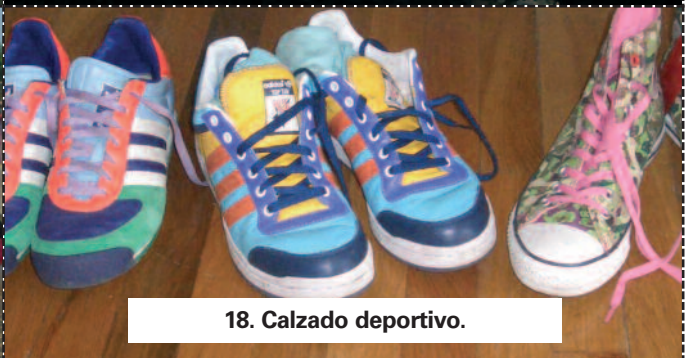
18. Calzado deportivo.