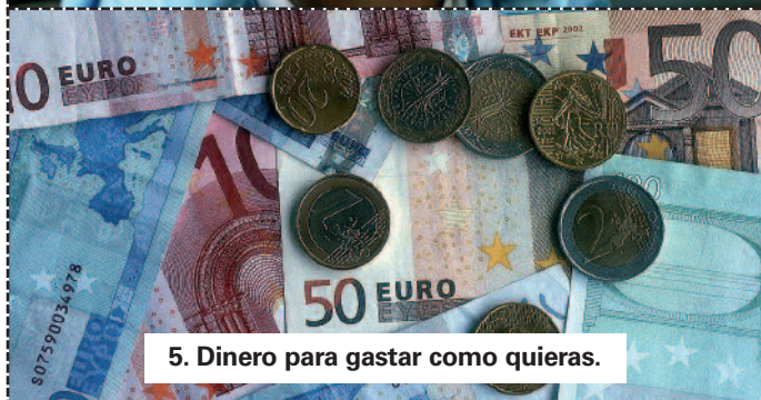
5. Dinero para gastar como quieras.