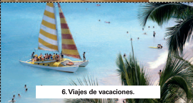
6. Viajes de vacaciones.