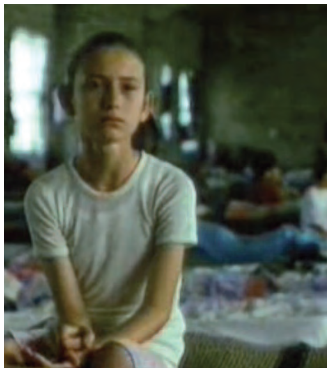
Fotogrames del vídeo El olvido de la memoria, d'Iñaki Elizalde, una pel·lícula que ens fa pensar sobre si n'aprenem, dels errors.