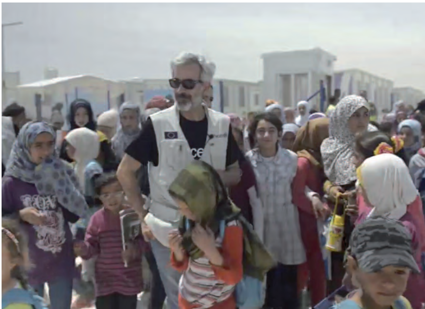
Imanol Arias en un camp de refugiats de Síria a Jordània, en una imatge que pertany al vídeo El viaje de Imanol.